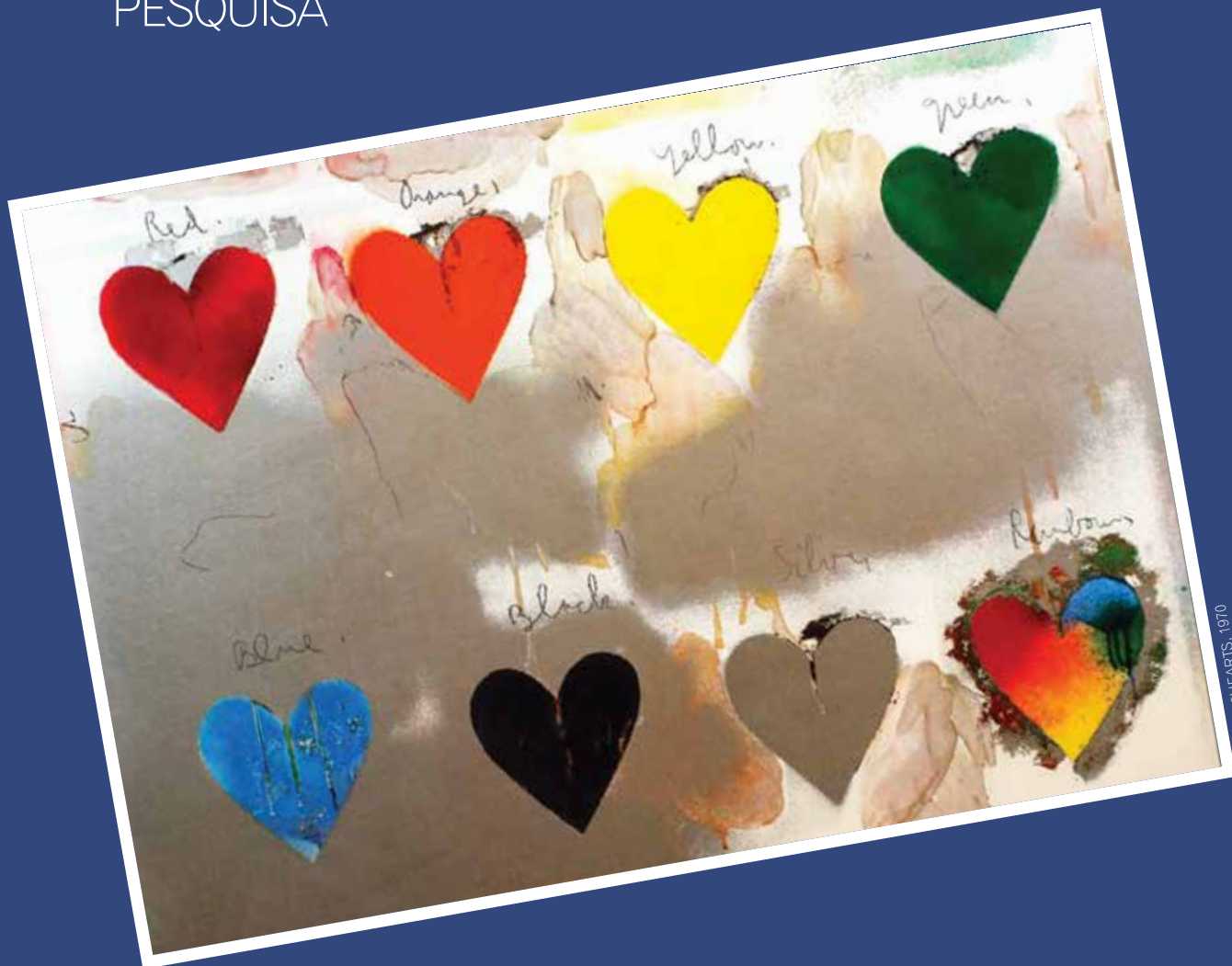
JIM DINE - 8HEARTS, 1970